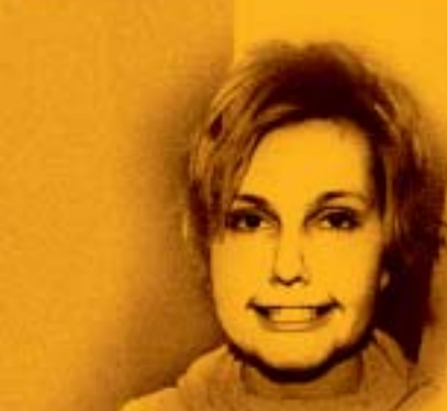
Smile! Smiling is a woman's job

Naeruhimulised isikud ehmuvad nõudlikke isendeid kohates vähem, nad panevad pigem tähele nende koomilisi külgi ja see aitab neil jääda enesele kindlaks. Seetõttu peetakse naeru kohati revolutsiooniliseks jõuks, kuna ta esitab väljakutse liiga jäikadele seisukohtadele ja krampis olekule, lisades ühekülgselale lähenemisele koomilise külje. Huumori abil vabaneme reeglitest, mis muudavad meie elu kitsaks ja ühesuunaliseks, nali tuletab meile meelde, et igal asjal on erandid ja vähemalt kaks või mitu hindamisvõimalust. Sestap on tihti peale nähtud naerus mässulist jõudu.