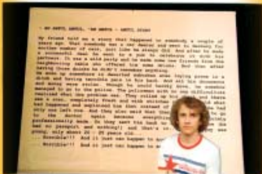
THAT'S ME AND MY FAMOUS BOOK, THE LARGEST ONE IN THE WHOLE WORLD. SIZE: 15H KILOH MY PRIVATE VIEW IN TALLINN 1990