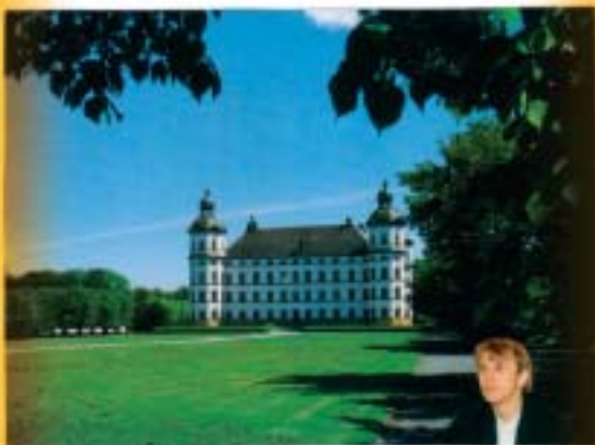
ME IN FRONT OF MY NEW HOME IN U.K. (TEN MINUTES WALK TO MY OWN GALLERY!) 1998