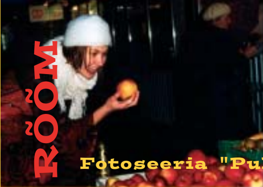
Fotoseeria "Puhas rõõm"