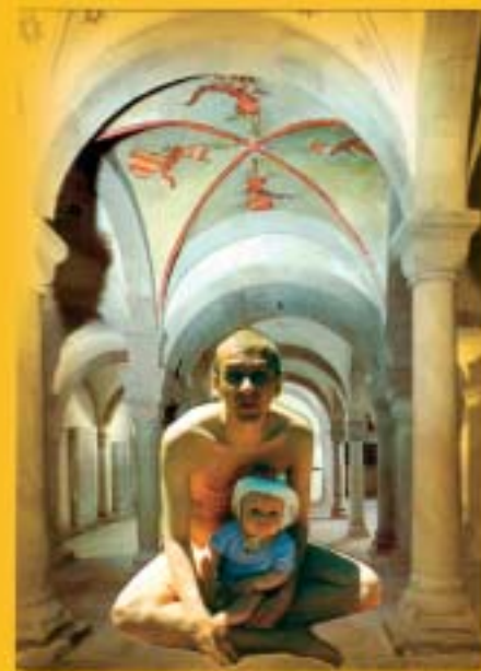
HE AND MY LITTLE DAUGHTER LEVITATING. ZÜRICH, 1990

Ei, ma ei ole nii naiivne, et loota revolutsiooni teha. Muidugi oleks tore, kui tööd oleksid revolutsioonilised. Mida ma arvan meeste positiivsest kunstist? Kõik, mis on natukegi emotsionaalselt üle keeratud, muutub groteskiks. Kardan, et kui ainult optimismi kultiveerida, siis on oht, et tuum jääb sinna varju. Mind on häirinud, kui mu töid naljakaks peetakse, sest tajun ohtu, et vaataja ei näe sealt ühel hetkel enam edasi. Ta näeb nalja, koomiksit – ja tuum läheb kaotsi, sellest oleks kahju. Mind huvitab hästi lai emotsioonide spekter. Mitte positiivsus eraldi. Mind huvitab pakkida ühte töösse terve kombinatsioon erinevaid emotsioone, kui asju, mis oleksid ühtaegu naljakad ja samas traagilised. Ühe emotsiooni kultiveerimine