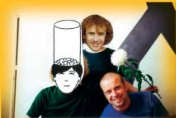
ME, MY STUDIOFRIENDS AND A MAN WITH A MASSIVE TUBE IN BEHIND (1999) - A PRIVATE VIEW!!!

Kunst võib olla positiivne ja kurb ja nukker. Reklaamil pole valikut, ta saab olla ainult rajalt optimistlik. Kunst võib olla positiivne, aga ta ei ole kohustatud olema optimistlik. See võiks lõppeda klounaadiga kunstis. Ka tohutult kurva meeoleoluga asi võib olla positiivne. Reklaamis tuleb anda piitsa. Kunst ja reklaam on täiesti erinevad asjad. Reklaam on otseselt funktsionaalne. Kunst on võimeline elama oma elu. Kui reklaamilt võtta ära eesmärk, siis jääb ta sihtmärgita. On ka pseudoreklaame, mis toimivad nagu kunstiprojektid. Kunst ei toimi nii lineaarselt. Ka mina olen deklareerinud, et kunst peab olema nagu liiklusemärk – optimistlik ja üheselt mõistetav. Olen selle perioodi seljataha jätnud.