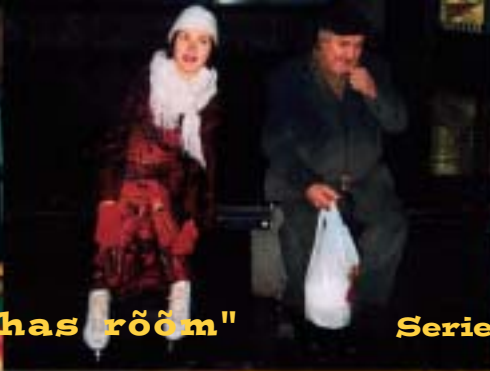
Series of photographs "Sheer Joy"