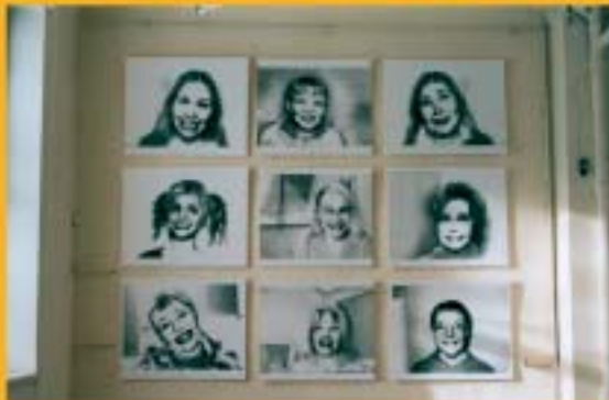
Naerata! Naeratus on naise töö