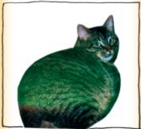
I AM INSIDE OF THAT CAT!!! LIVE PERFORMANCE AT MY PRIVATE VIEW IN OSLO, 1984